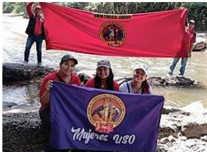
! Mujeres con alegría enarbolan banderas de dignidad y lucha en la quebrada Laputana, donde en la clandestinidad se fundó la USO. 10 de febrero de 2023. Foto Archivo USO.

En estas condiciones, no los podíamos defraudar, y por eso hemos realizado un denodado esfuerzo para producir esta obra que esperamos sea un soporte material e intelectual en la lucha de los trabajadores colombianos si se tiene en cuenta que, para andar con pie firme en el presente, y hacia el futuro, se requiere estar bien afincado en el pasado. Nos queda la satisfacción de haber contribuido con nuestra fuerza, energía y compromiso, sin ningún reconocimiento ni mercantil ni académico, a recuperar estas historias, a partir de un presupuesto básico de Walter Benjamin: “Más difícil es honrar la memoria de los sin nombre, que la de los famosos, de los festejados [...] La construcción histórica está consagrada a la memoria de los sin nombre” 5 .