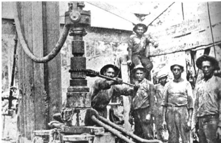
Obreros de la Troco en los primeros años de la explotación petrolera. El Gráfico , No. 411-412, mayo 25 de 1918, p. 90.

Del exterior también llegaron trabajadores, pues la Troco enganchó obreros calificados de origen caribeño y antillano, conocidos con el apelativo de Yumecas , negros fuertes y resistentes que habían demostrado su capacidad de trabajo en empresas y enclaves de banano, azúcar y otros productos. Paradójicamente, los yumecas fueron considerados por los trabajadores colombianos como parte de la elite de la empresa, que los incorporó como personal fijo y los “alojó” en instalaciones muy superiores a los campamentos miserables y desvencijados en los que residían los obreros colombianos. Los yumecas tenían una ventaja con respecto a los trabajadores colombianos, puesto que hablaban inglés y tenían experiencia en trabajos similares en otros enclaves del Caribe (tal como el del Canal de Panamá), lo cual les permitía relacionarse de manera más fácil y directa con los capataces, administradores e ingenieros de la Tropical. Como resultado de diversas influencias étnicas, Barrancabermeja se convirtió desde la década de 1920 en un crisol cultural, como lo registró pocos años después el escritor y poeta Tomas Vargas Osorio: “Japoneses menudos y avellanados; chinos reverentes y humildes; gringos con camisas de kaki fuerte y botas ferradas; alemanes de cabeza rasurada, blancos y rollizos; negros de Cuba, mulatos de la costa, hombres de Antioquia y de Santander con sus camisas blancas de seda y su andar ligero y vivo” 2 .