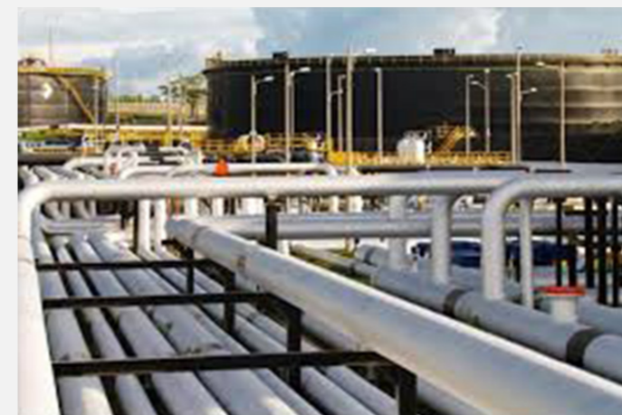
“Las Arterias de Ecopetrol”

En contraste los riesgos de Cenit son fácilmente mitigables, porque están relacionados a la inversión en nueva infraestructura, al control de los costos de operación, y a la operación, lo que deriva en que los ingresos y utilidades de Cenit tengan mayor estabilidad. En Cenit los ingresos son fijos en dólares por barril transportado, a través de contratos en modalidad úselo o páguelo, en donde cada agente que envía crudo ha firmado previamente contratos a largo plazo por un determinado volumen de