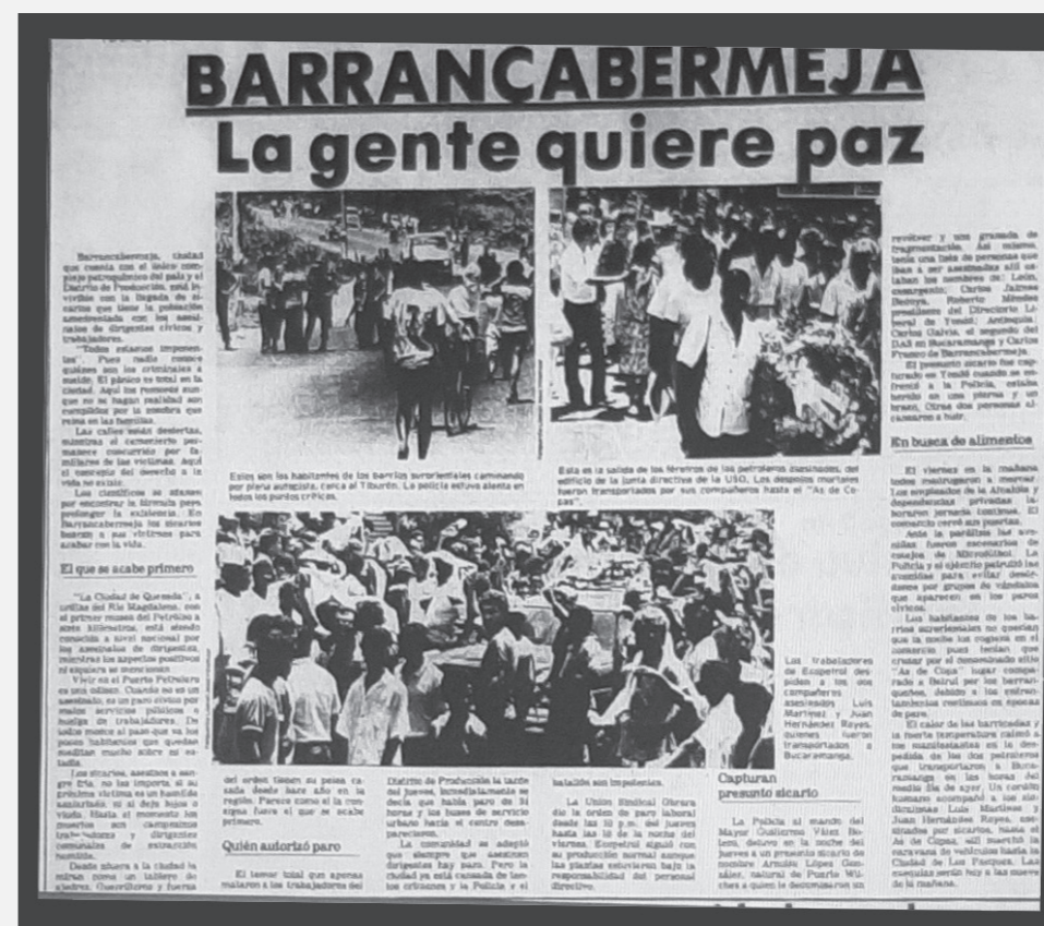
Los féretros salen de la sede de la USO. Vanguardia Liberal, sábado 30 de julio de 1988.