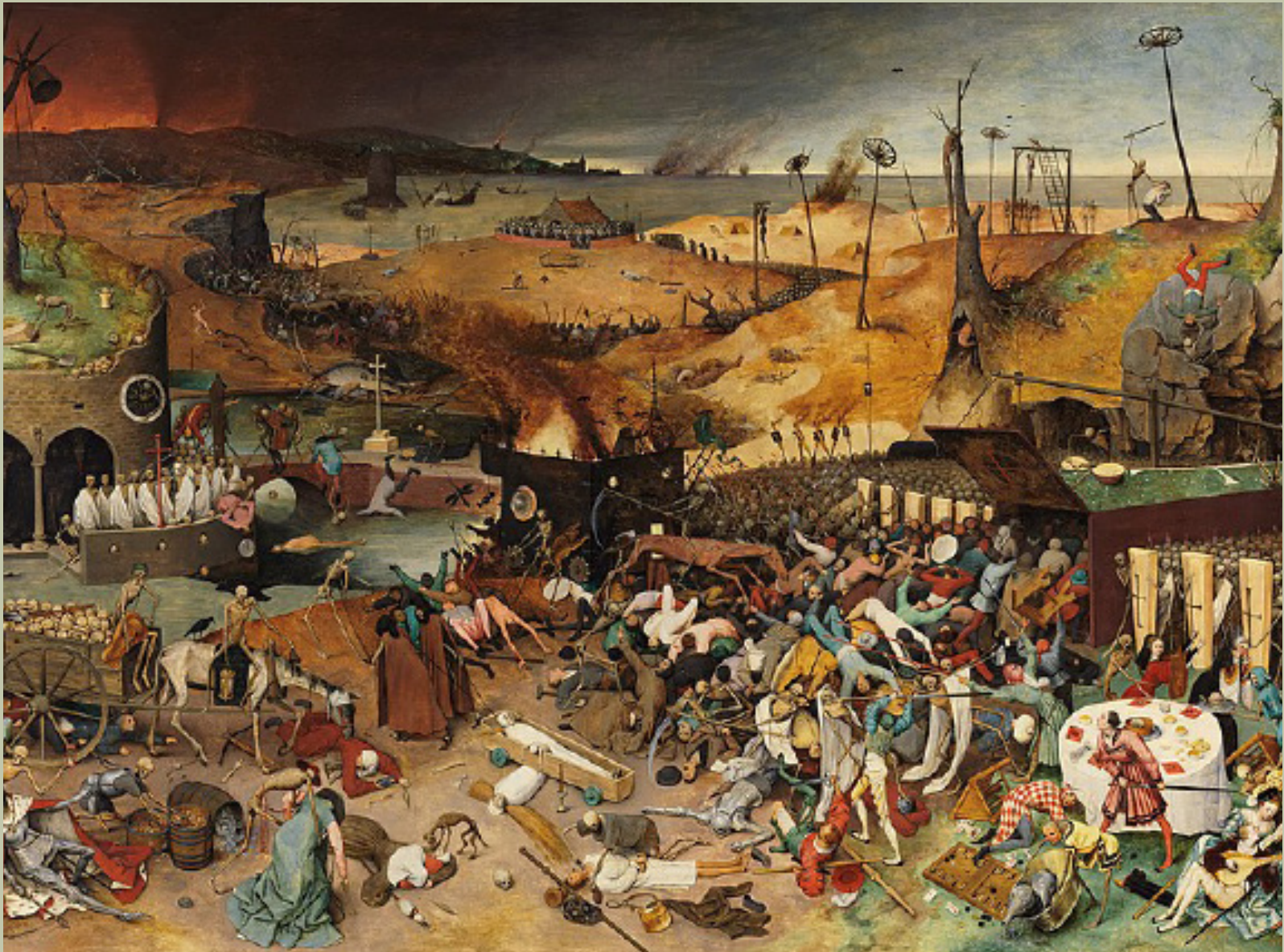
El triunfo de la Muerte (De Triomf van de Dood), de Pieter Bruegel el Viejo (1562).